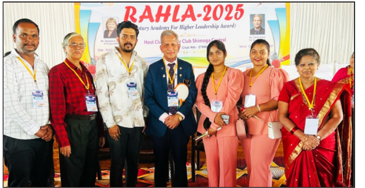
ROTARACT Members Attending RAHLA